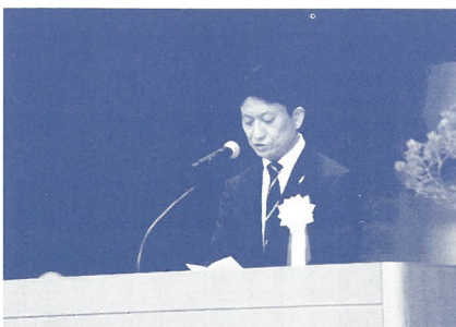
「第56回 秋田県更生保護大会」にて