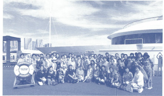
東京湾シンフォニークルーズ