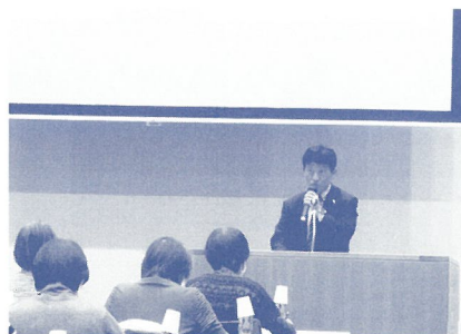
「令和5年度更生保護女性会新会員等研修」にて