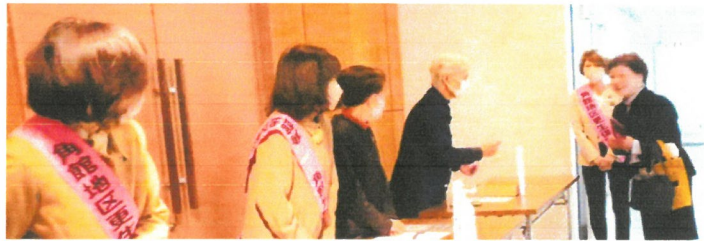
秋田県更生保護女性連盟会長をお迎え