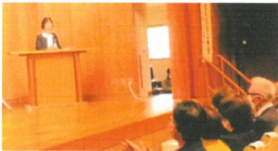
千葉会長あいさつ