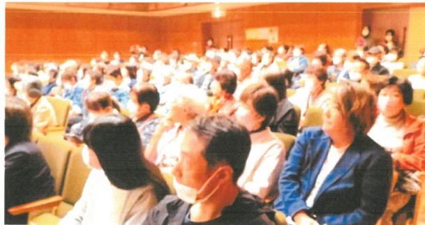
— 満員のお客様 —