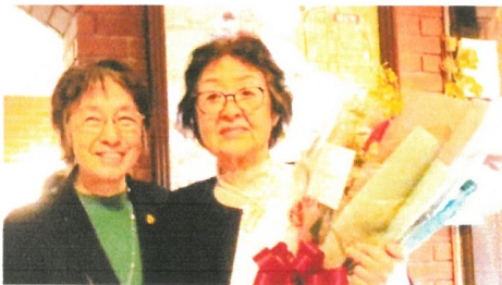
花束もいただきました