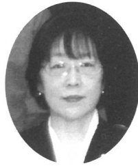
犯罪予防活動部 部長